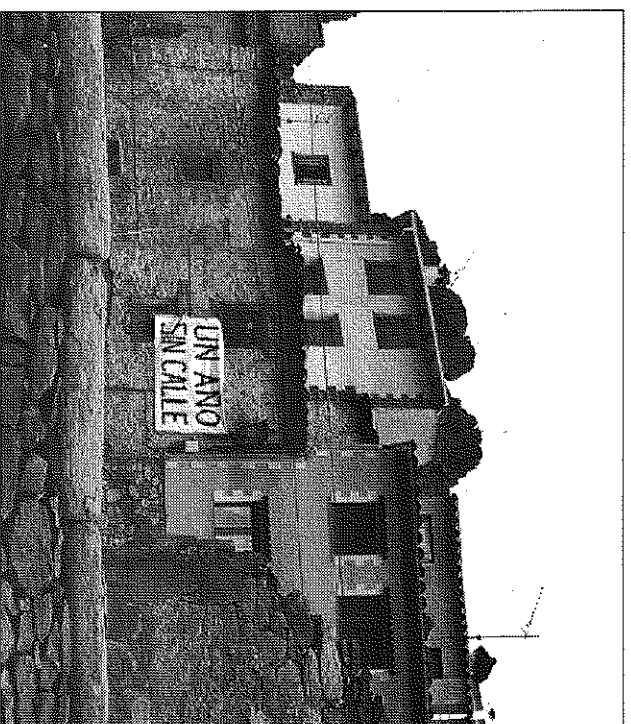
Pancarta para reclamar que se repare el muro y la calle Mayor

El plazo dado para la ejecución de la construcción del muro de la calle Mayor de Allepuz ha sido de un mes desde que se firma el acta de replanteo. Las obras van a consistir en levantar encofrados para la construcción del muro. La longitud del muro que se desplomó alcanza la treintena de metros y está situado en el solar de la denominada Casa del Conde. Con el derrumbe quedaron destruidas también las tuberías y los desagües de toda la calle y el Ayuntamiento los sustituyó por otros provisionales para poder dar servicio a los vecinos afectados por el hundimiento del muro.