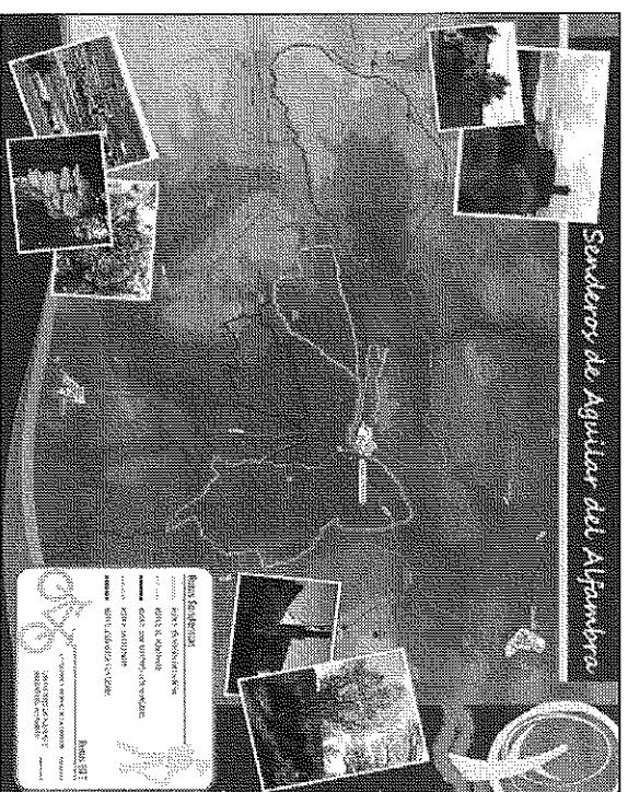
Plano de las rutas senderistas de Aguilar del Alfambra

damente señalizadas con símbolos homologados. Además se han dotado con cuatro paneles interpretativos que contienen textos explicativos con datos prácticos y curiosos, y claves que permiten conocer e interpretar el paisaje y su evolución. El trazado, el tiempo medio de los recorridos y la dificultad de las rutas también pueden consultarse en folletos de bolsillo editados a tal fin.