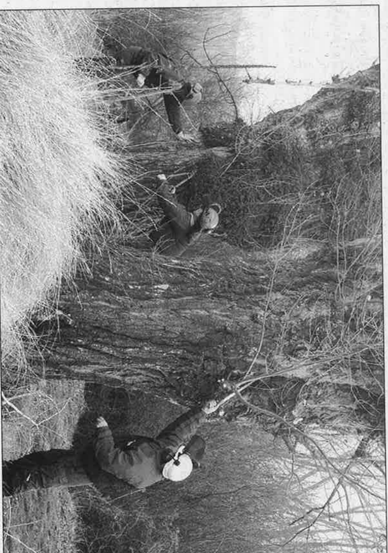
La labor de trasmochar los chopos cabeceros la realizan los alumnos desde el suelo por seguridad

da del chopo cabecero es en Pancrudo, Aguilár del Alfambra, El Pobo, Jorcas, Galve, Camarillas y Ababuj.