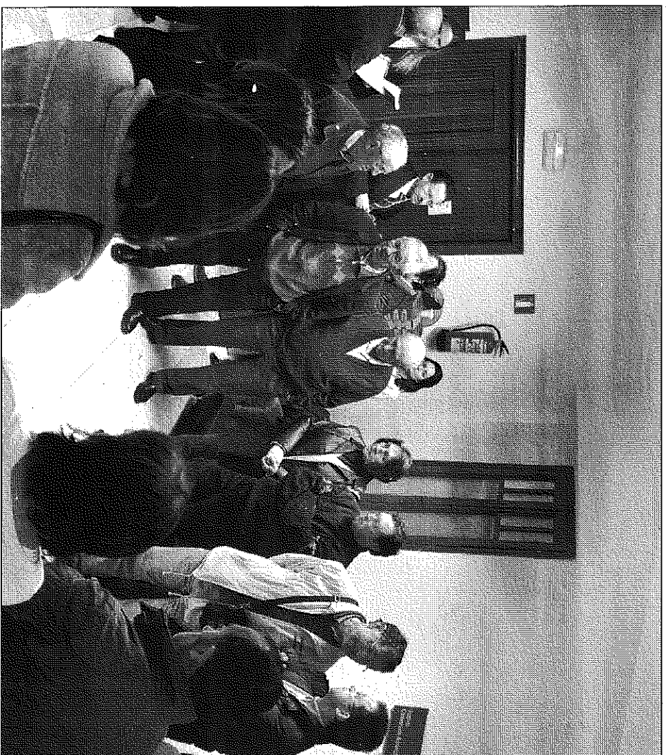
Vecinos de Aguilar del Alfambra, el año pasado, en el Juzgado de lo Contencioso Administrativo

La empresa alegó en su momento que ni el volumen de la explotación ni la distancia a la que se encuentra de la población impedirían que fuese el Ayuntamiento quien otorgase la licencia ambiental. Pidió por ello al juzgado que declarase nulo el acuerdo