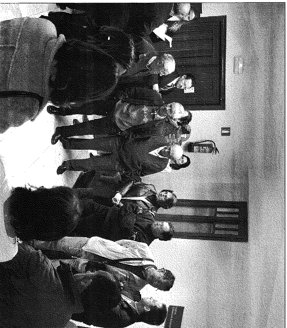
Vecinos de Aguilar del Alfambra, el año pasado, en el Juzgado de lo Contencioso Administrativo

La empresa alegó en su momento que ni el volumen de la explotación ni la distancia a la que se encuentra de la población impedirían que fuese el Ayuntamiento quien otorgase la licencia ambiental. Pidió por ello al juzgado que declarase nulo el acuerdo